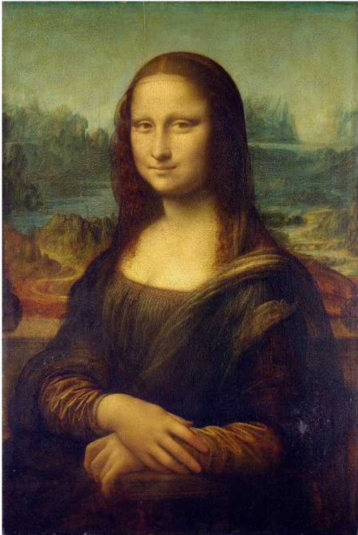
Λεονάρντο Ντα Βίντσι, «Μόνα Λίζα» (1503-1519), λαδομπογιά σε ξύλο, 77Χ53 εκ.