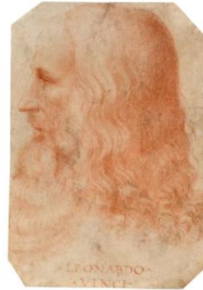
Francesco Melzi, «Πορτρέτο Λεονάρντο Ντα Βίντσι», (1515–1517)