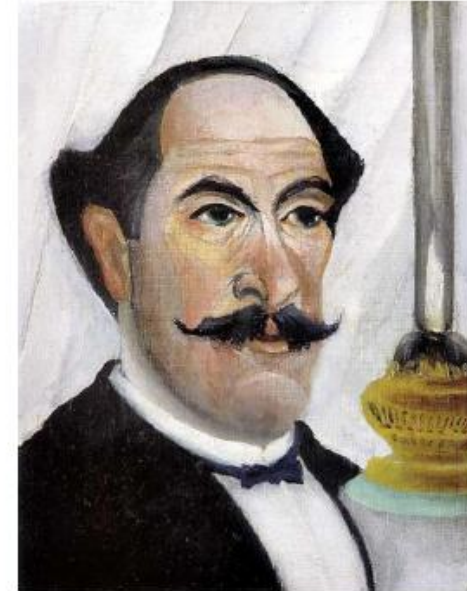
Ανρί Ρουσσώ, «Αυτοπροσωπογραφία» (1903), λάδι σε καμβά, 23X19 εκ.

https://www.youtube.com/watch?v=vWQpZiiN4Hw