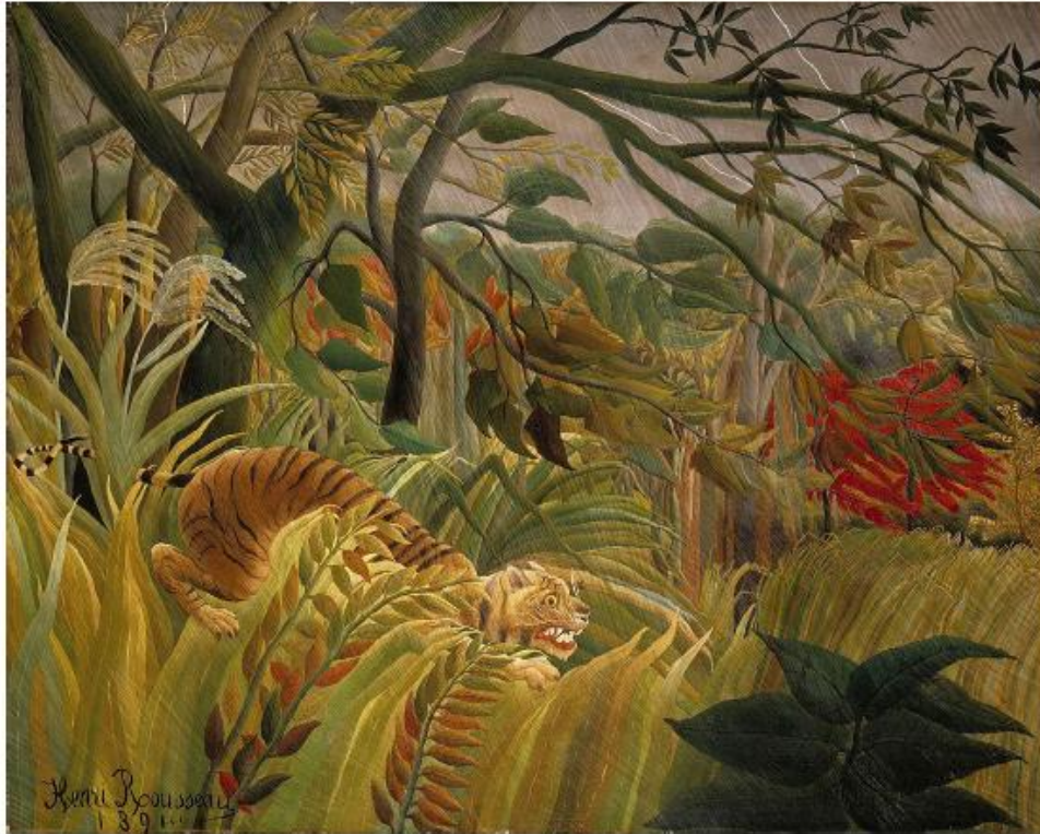
Ανρί Ρουσσώ, “Εκπληξη” (1891), λαδομπογιά σε καμβά, 128X161 εκ.